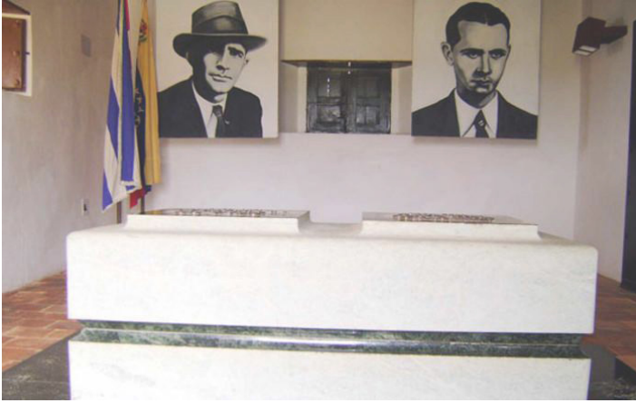
Memorial de El Morrillo donde reposan los restos de Guiteras y Aponte

Por un accidente a los cuatro años pierde el control del lado derecho de su cuerpo y se convierte en zurdo, y también le falta la visión del ojo izquierdo, que se le desvía en cierto grado.