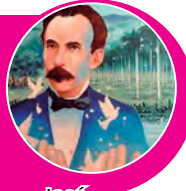
José Julián Martí Pérez

La única verdad de esta vida, y la única fuerza, es el amor. El patriotismo no es más que amor. La amistad no es más que amor