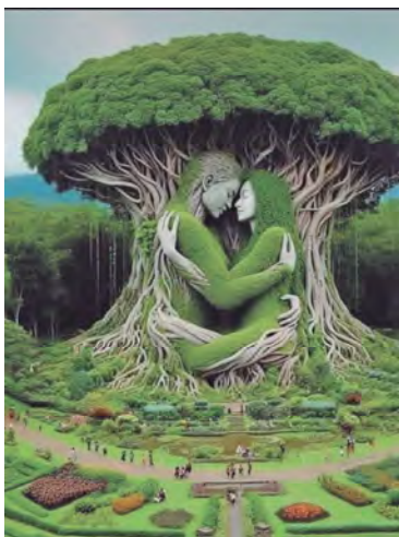
Lección de amor de la naturaleza.