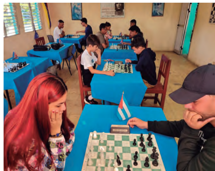
La ajedrecista pinera se prepara en su tierra junto a su entrenador y demás compañeros

"Para los atletas de la Isla siempre ha sido complicado poder salir a competir, ese inconveniente dificulta un poco el desarrollo, pero he notado que se avanza, están haciendo nuevos torneos, veo a más niños, en especial los pequeños que se han ido incorporando, lo cual constituye una gran noticia para el deporte en el territorio de forma general y sobre todo para el ajedrez; por eso los animo a que continúen sumándose a la práctica de esta bonita disciplina, porque al final cualquier actividad deportiva es buena para la salud tanto física como mental y además una excelente manera de ocupar el tiempo libre", concluyó.