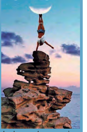
La luna sobre sus pies.