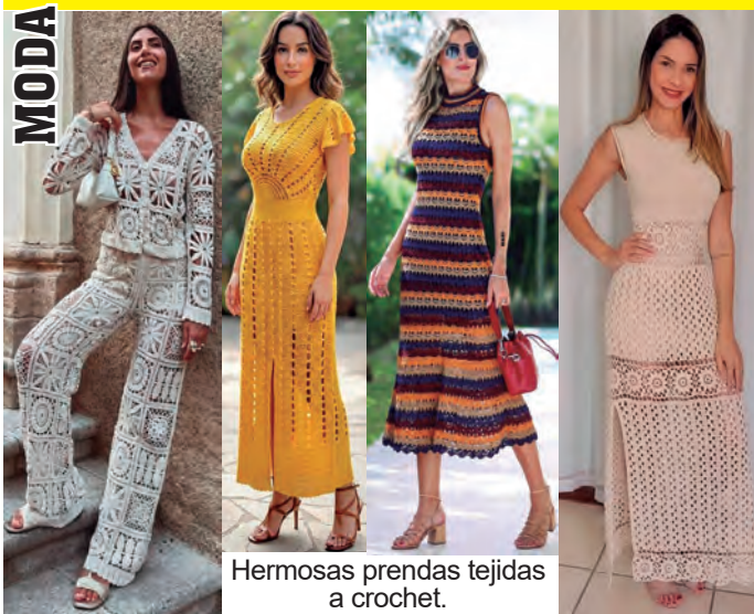
Hermosas prendas tejidas a crochet.