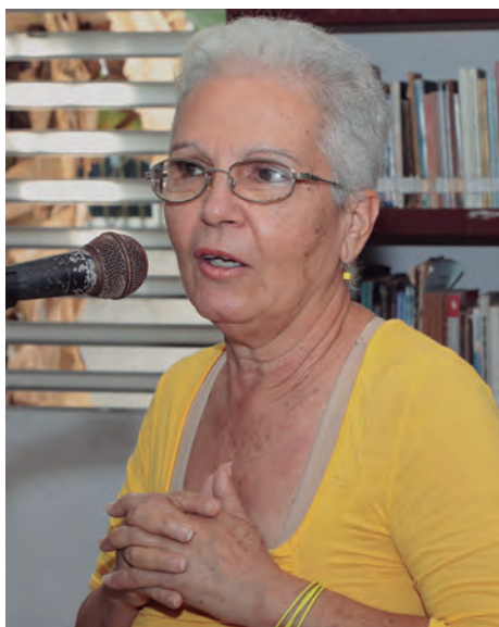
A la consagrada Aleida Montes de Oca se dedicó la primera versión del espacio

"Teníamos bastante trabajo aquí y actividades extras. Era como un complejo, porque además del préstamo de servicios internos y externos, íbamos a la prisión a realizar actividades y auspiciábamos o coauspiciábamos eventos como el Mangle Rojo, Mármol Sol o el Todo Cerámica... girábamos en torno a la vida cultural de la Isla, podía ser de la Unión de Escritores y Artistas de Cuba, la Asociación Hermanos Saiz, la Dirección de Cultura, de quien fuera.