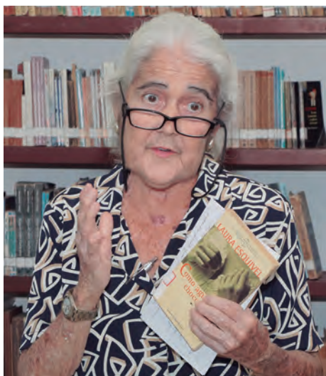
Como agua para chocolate fue el título presentado

Como parte del cumpleaños 61 desde este miércoles y hasta el lunes 19, día de su inauguración, se sucederán allí matutinos especiales; el colectivo de trabajadores rescatará el espacio La tertulia entre amigos , harán una edición especial de El patio de los sueños y dentro de la jornada se desarrolla también un encuentro deportivo de ajedrez para personas en situación de discapacidad del 12 al 15, explicó Sotomayor.