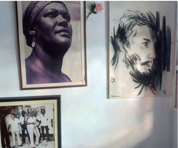
La muestra comprende fotografías, dibujos, el trabajo con fibras...