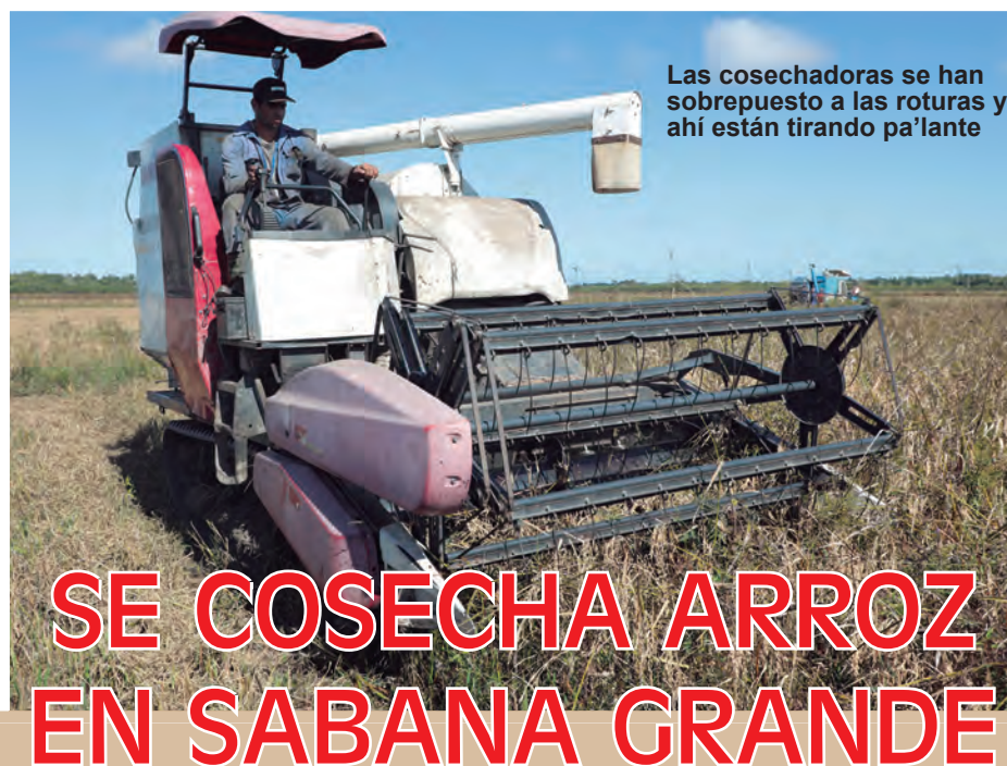
Las cosechadoras se han sobrepuesto a las roturas y ahí están tirando pa'lante

En relación con la capacidad de ese par de equipos explicó: “Las hectáreas que logran abarcar están en dependencia del tramo que recorra la máquina. Si hay bastante arroz recorre