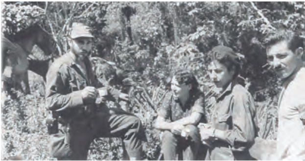
Fidel Castro Ruz, Haydée Santamaría Cuadrado, Celia Sánchez Manduley en la Sierra Maestra

En el discurso de despedida de duelo de Celia, en la Necrópolis de Colón, en