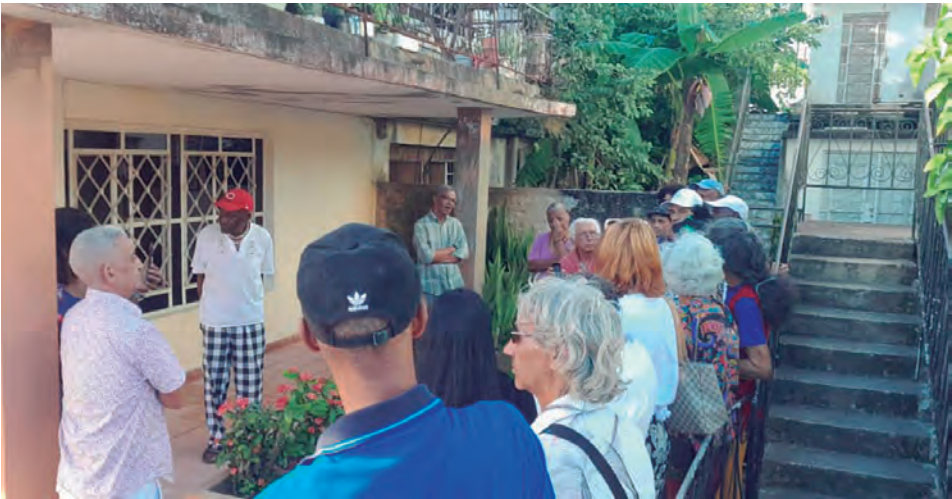
En la inauguración estuvieron presentes vecinos, artistas y pueblo en general