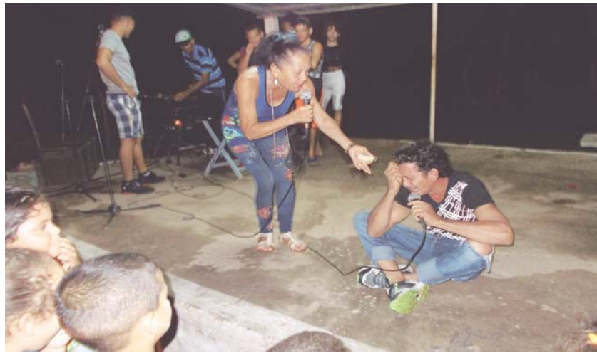
Aficionados de las comunidades enriquecieron los espectáculos culturales

Los aficionados también aportaron su talento y enriquecieron los espectáculos, complementos