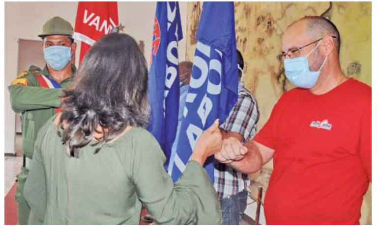
El director de RadioCuba recibe la condición colectivo Vanguardia Nacional

La ocasión también fue propicia para reconocer con la