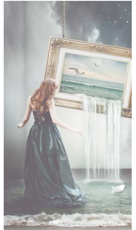
¿Se desbordó el cuadro?