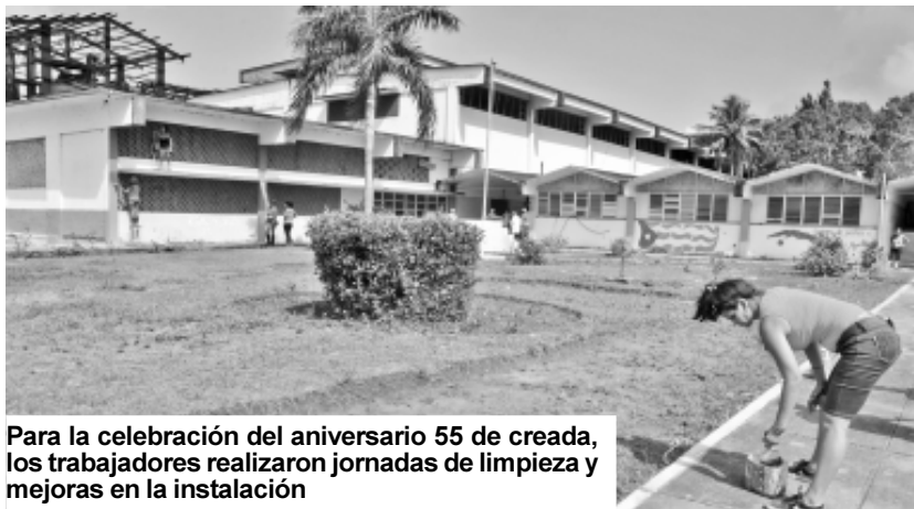
Para la celebración del aniversario 55 de creada, los trabajadores realizaron jornadas de limpieza y mejoras en la instalación

La lucha por la independencia de la Patria sobrevivió la prematura muerte del Apóstol y aunque su legado anticolonialista quedó trunco en la falsa república, permaneció como tarea inconclusa para los revolucionarios cubanos hasta que la Generación del Centenario de su nacimiento en 1953 la llevó a feliz término el Primero de Enero de 1959. Martí todavía nos convoca y guía.