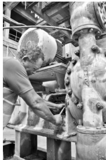
Es constante y arduo el trabajo de los innovadores