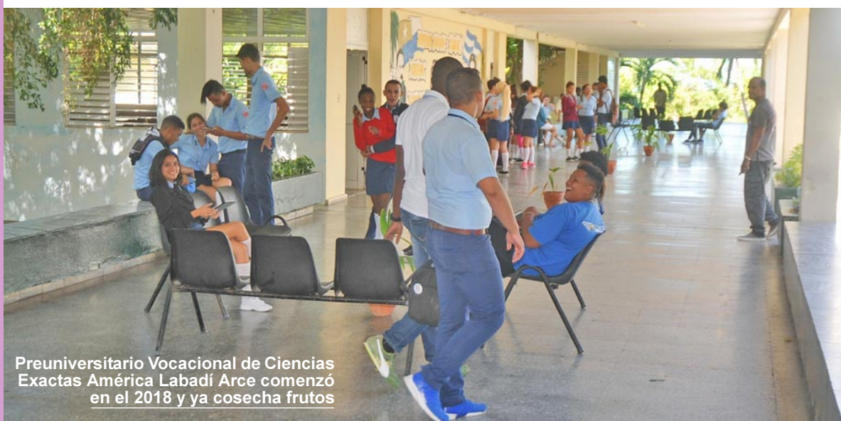
Preuniversitario Vocacional de Ciencias Exactas América Labadí Arce comenzó en el 2018 y ya cosecha frutos