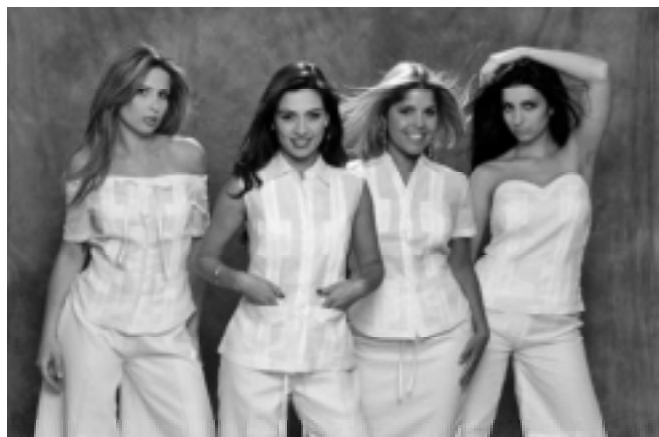
Vuelve la guayabera con su cubanía.