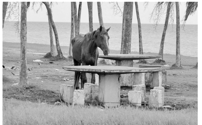
Animales pastan cerca de las dunas como si se tratase de su hábitat habitual