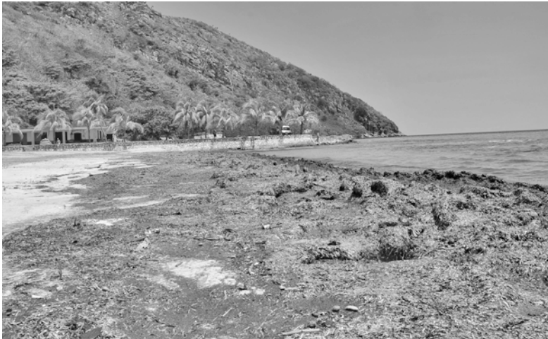
En Punta de Piedra y Paraíso el sargazo se ha apropiado de gran parte de la arena

POR Gretter Manso Rodríguez (*)