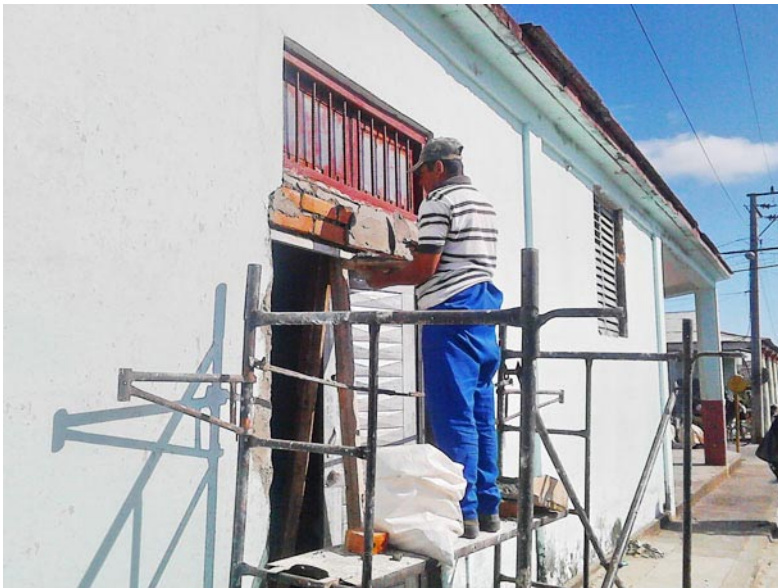
Orlando aporta con orgullo al cambio en la unidad