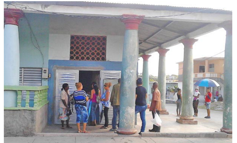
Remodelación también en la carnicería

“Este movimiento que hoy se intensifica fundamentalmente