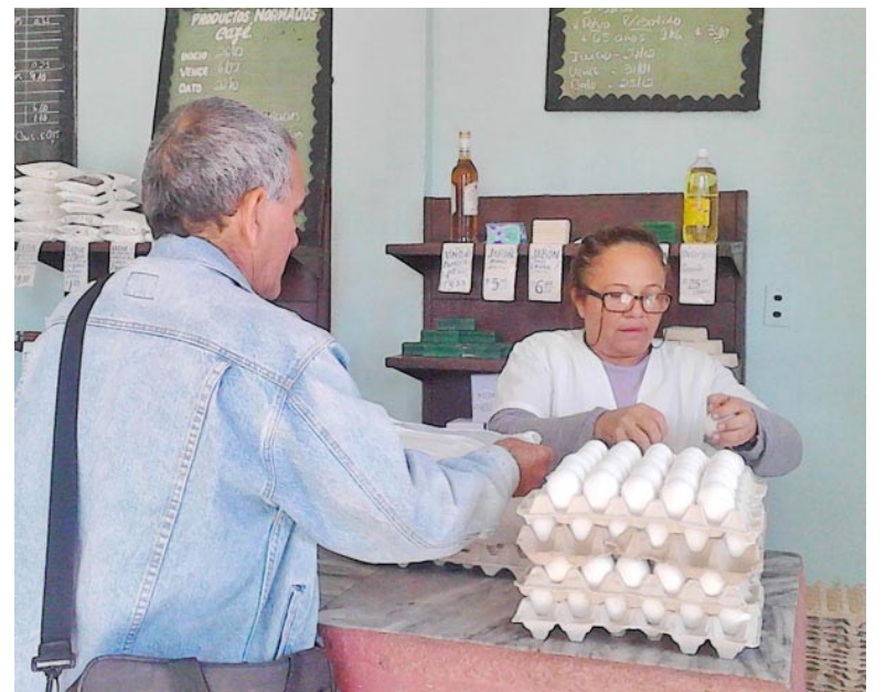
La atención al consumidor es una prioridad